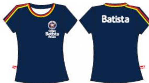
Camisa Malha PV Feminina Baby Look - COD. BAT 005 Ensino Médio