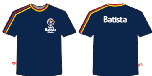
Camisa Malha PV Masculina e Feminina Tradicional - COD. BAT 004 Ensino Médio