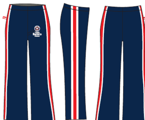
Calça Helanca Feminina - COD. BAT 011 Educação Infantil ao Ensino Médio