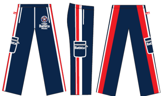
Calça Tactel Masculina / Feminina - COD. BAT 008 Educação Infantil ao Ensino Médio