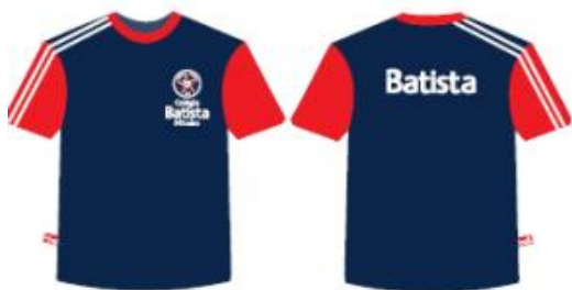
Camisa Malha PV Masculina Tradicional - COD. BAT 001 Educação Infantil ao Ensino Médio