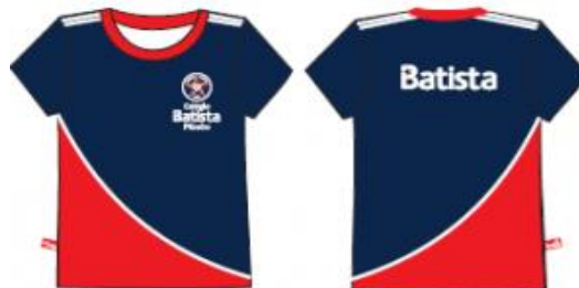
Camisa Malha PV Feminina Tradicional - COD. BAT 003 Educação Infantil ao Ensino Médio