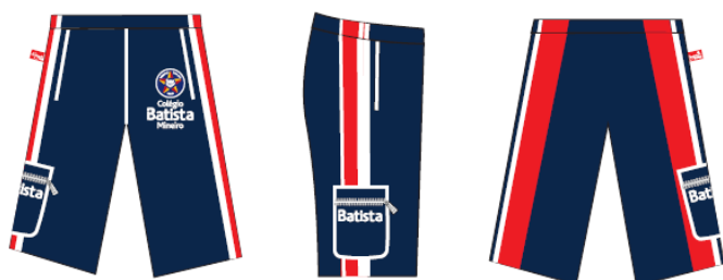
Bermuda Tactel Masculina - COD. BAT 009 Educação Infantil ao Ensino Médio